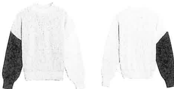
VALENTINE WITMEUR LAB, model "Prudish", Spring/Summer 2018

VW heeft onder meer volgende truien ontworpen :