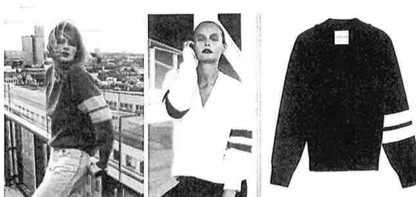
VALENTINE WITMEUR LAB model "Punctualist" Herfst/Winter 2015 - 2016, model "Egoist" Lente/zomer 2017